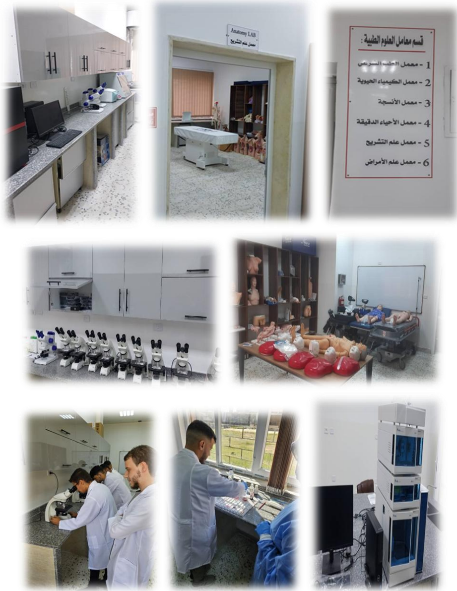
الشكل 3-1: معامل كلية الطب البشري

كما تم تجهيز كلية الصيدلة بعدد من الاجهزة المعملية لتوفير بيئة علمية متكاملة للاستكشاف والتطبيق العملي لكي تواصل معامل كلية الصيدلة أداء دورها الحيوي في تقديم التجربة التعليمية المتكاملة لطلاب كلية الصيدلة، حيث تجمع هذه المعامل بين المعرفة النظرية والخبرة العملية، وتتيح فهماً عميقاً للعمليات الصيدلانية والتركيبات الدوائية والمراقبة الدوائية والتصنيع، مما يوفر بيئة علمية متقدمة لإجراء التجارب العلمية بدقة ومهنية عالية، حيث يتمكن الطلاب من دراسة العلوم الصيدلانية وعلاقتها بوظائف الكائنات الحية، بما يعمق فهمهم للأسس العلمية للحياة وتطبيقاتها العملية في مجال الصيدلة والبحث العلمي وإعداد جيل من الصيادلة القادرين على ممارسة مهنة الصيدلة بكفاءة واحترافية والمساهمة بفاعلية في مجال الصحة والبحث العلمي. وبالتعاون مع مكتب متابعة وتطوير المعامل بالوزارة تم إجراء العديد من الدورات التدريبية على هذه الاجهزة وذلك لتوفير فنيين ذوي كفاءة عالية لضمان تشغيل المعامل وخدمة الأغراض التعليمية والبحثية.