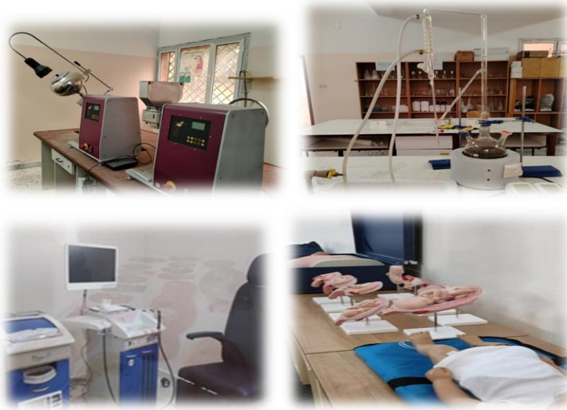
الشكل 3-3: معامل كلية التقنية الطبية

كما تم تزويد كلية التقنية الطبية بعدد من الاجهزة المعملية وذلك لتقديم تعليم طبي متميز وإعداد كوادر طبية مؤهلة قادرة على تقديم الخدمات والرعاية الصحية من أجل تزويد طلاب الجامعة بالمعرفة الطبية الأساسية، وتنمية مهاراتهم من خلال هذه الأجهزة.