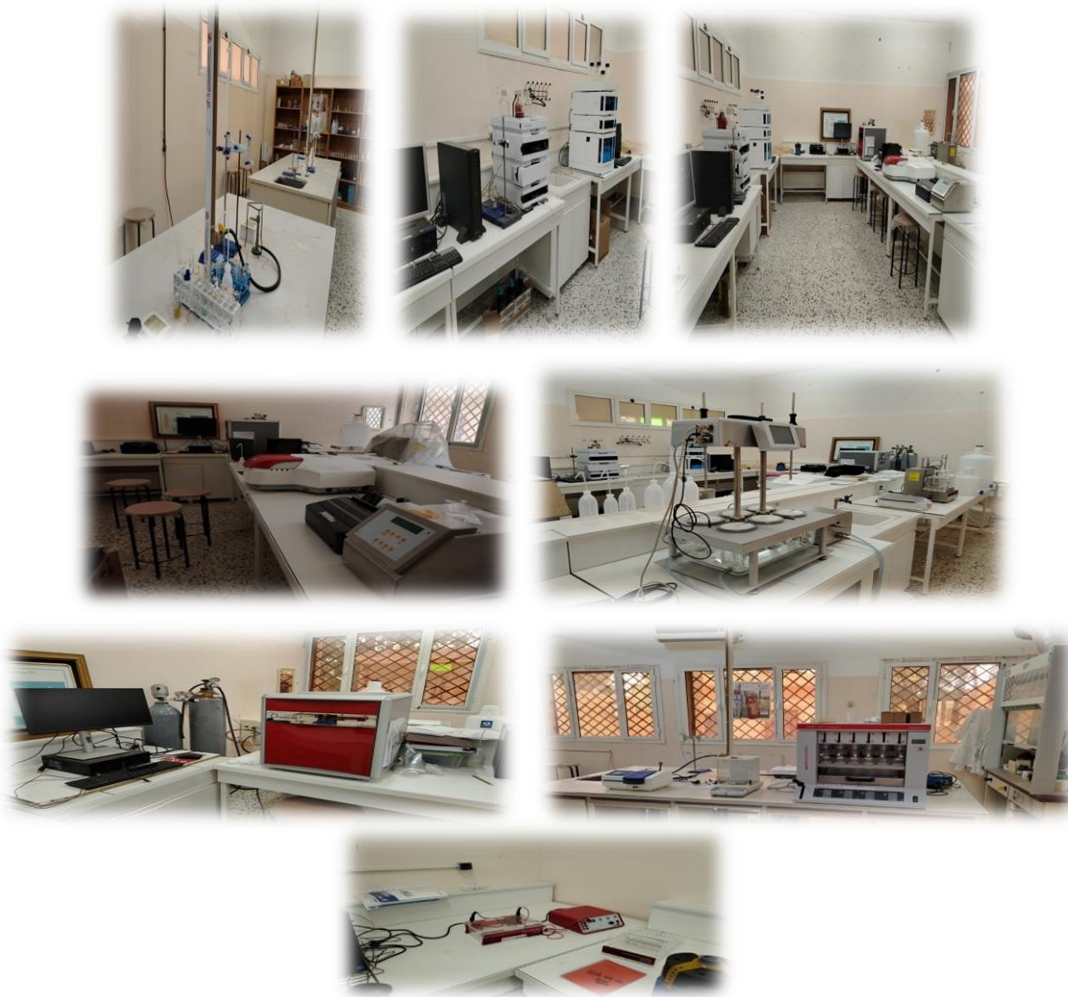
الشكل 2-3: معامل كلية الصيدلة

كما تم تزويد كلية التقنية الطبية بعدد من الاجهزة المعملية وذلك لتقديم تعليم طبي متميز وإعداد كوادر طبية مؤهلة قادرة على تقديم الخدمات والرعاية الصحية من أجل تزويد طلاب الجامعة بالمعرفة الطبية الأساسية، وتنمية مهاراتهم من خلال هذه الأجهزة.